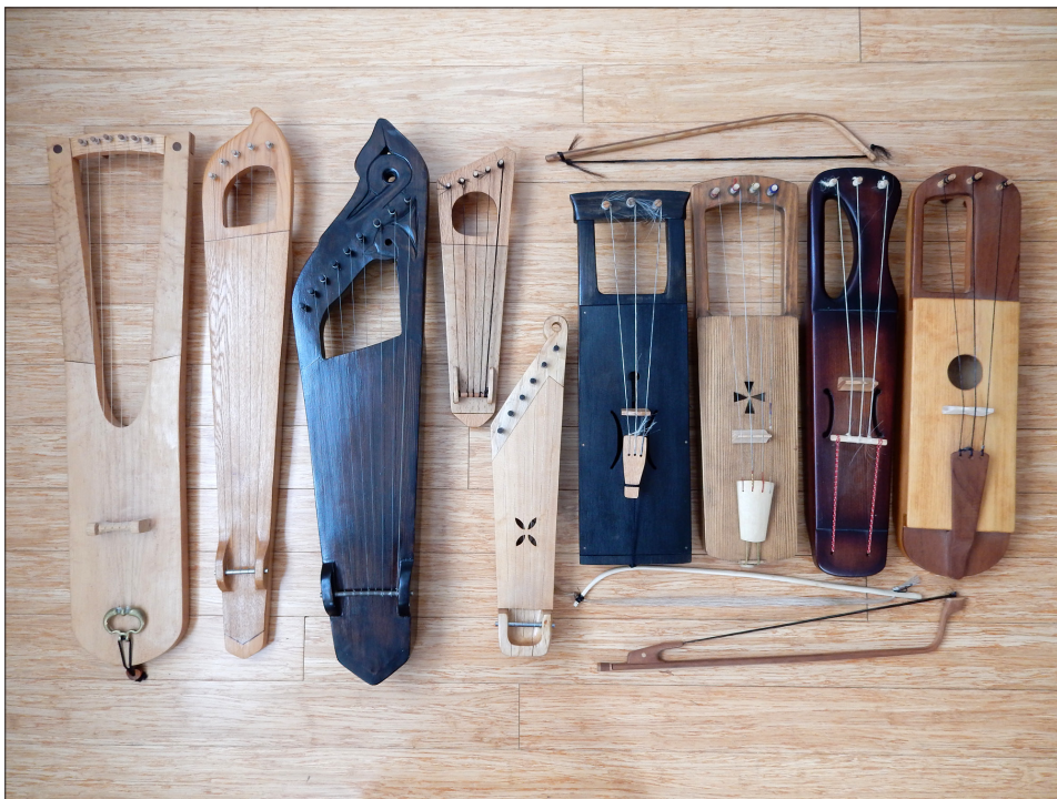
Foto 1. Kirde-Euroopa keelpillide rekonstruktsioonid. Vasakult: (1) Oberflächti lüüra (Saksamaa, 6. sajand); (2) Sloviška gusli (Novgorod, Venemaa, 11. sajand); (3) Nerevski gusli (Novgorod, Venemaa, 13. sajand); (4) Gdanski lüüra (Poola, 13. sajand); (5) Kaarma kannel (Saaremaa, 1890); (6) Noarootsi talharpa (umbes 1755); (7) Vormsi talharpa; (8) Karjala jouhikko (Loode-Venemaa); (9) moodne jouhikko (Soome). Nr-d 1–6 tegi Ain Haas Indianapolises (USA); 7–9 on tehtud Soomes. Ain Haasa foto 2015.

See võimaldab mängida rohkem viise. Vanade noodistuste ja helisalvestuste põhjal võib ka oletada, et häälestus oli samamoodi diatooniline, vahel mõne madala burdoonkeelega, aga pole alati selge, kas mängija kannel oli arhailist tüüpi või moodne. Katrin Valk (2005: 39–40) analüüsis Armas Otto Väisäneni 1913. aastal vaharullidele tehtud helisalvestusi Setumaa retkedelt ja avastas, et mõlemad mainitud heliread olid tol ajal kasutusel 6-7 keelega kannedel. Oli ka teisi variante, näiteks üks burdoonkeel (C-duuris oleks see madal G) või kaks (ka veelgi madalam C), ja minoorne häälestus C, D, Eb, F, G.