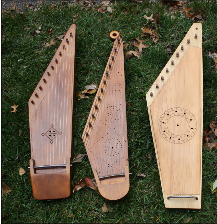
Foto 2. Autori tehtud jäljendeid muuseumieksplaridest. Vasakult: 11keeleline teadmata päritoluga kannel, 12keeleline Vändra kannel (originaal tehtud 1804. aastal), üheksakeeleline Rõngu "vaimude peletamise kannel" (umbes 1820. aastal tehtud originaalil oli 8 keelt). Ain Haasa foto 2012.