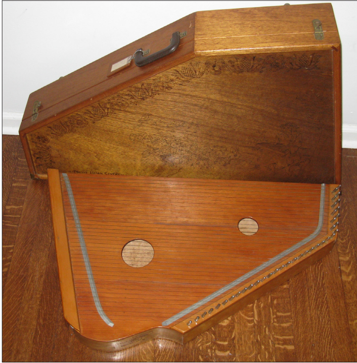
Foto 3. Valter Raudkivi 37keeleline kannel, mille ta tegi Baltimore'is (USA) 1967. aastal oma tütrele Lilian Esopile. Kandlekasti kaanel on joonistus Vanemuise kandlemängust lindude-loomade ees. Raudkivi võttis samasuguse 1935. aastal enda tehtud 34keelelise kandle kaasa, kui põgenes sõja lõpus Viru-Jaagupist. Ain Haasa foto 2014.

tihti ikkagi vana kandle kujuga, aga Eestis kadus traditsiooniline labajalakuju. Selle asemele tuli trapetsikujuline kannel või harfinetikujuline kannel (mis sarnaneb klaverikeelte raamiga, kuna üks külg on S-tähe moodi kaardus).