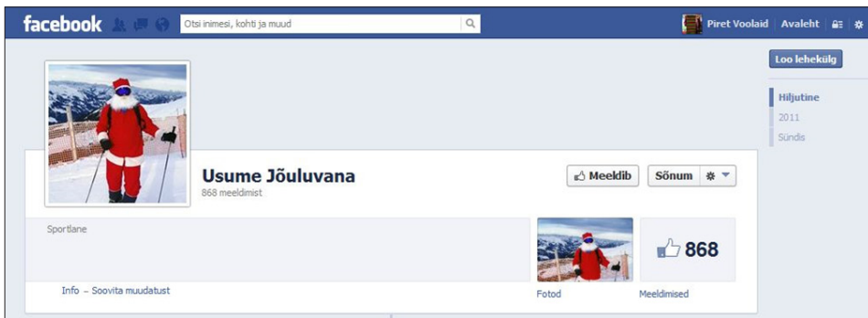
Foto 2. Facebooki kommuuni “Usume Jõuluvana” profiil ( https://www.facebook.com/pages/Usume-Jõuluvana/216788421669360 ).