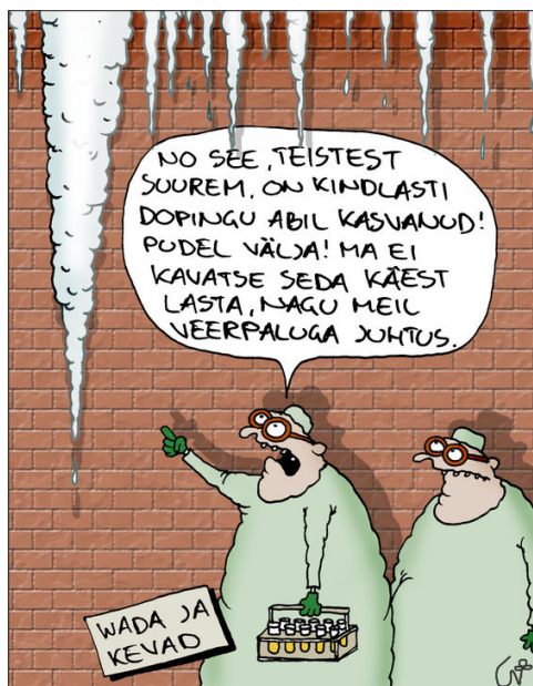
Foto 6. Urmass Nemvaltsi karikatuur Postimehes pärast õigeksmõistvat kohtuotsust (27. märts 2013, http://arvamus.postimees.ee/1183244/paeva-karikatuur-wada-jatkab-voitlust ).