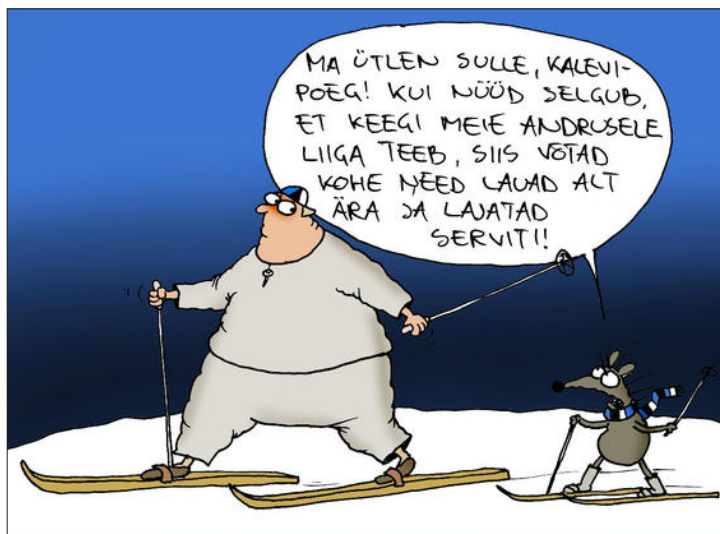
Foto 5. Urmass Nemvaltsi karikatuur ajalehe Postimees arvamusküljel (7. aprill 2011, http://arvamus.postimees.ee/415846/paeva-karikatuur-kaed-eemale-andrus-veerpalust ).