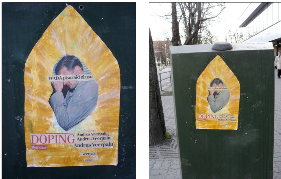
Foto 3. Üks väheseid sportlast pilavaid pilditöötusi dopinguskandaali vältel. “WADA pisaraid ei usu” on ühtlasi viide omaaegse nõukogude menufilmi pealkirjale “Moskva pisaraid ei usu”. Tallinna linnaruumis pildistatud poster levis hiljem internetis ( http://urbanepiphany.wordpress.com/page/5/ ).